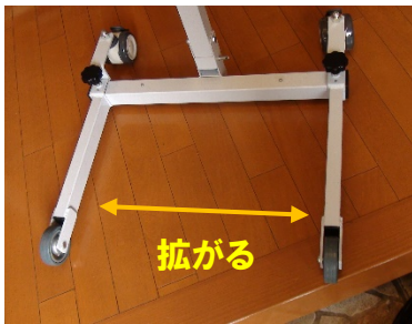
ポータブルの場合