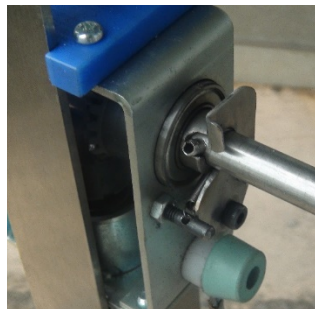
床から使用の場合位置です