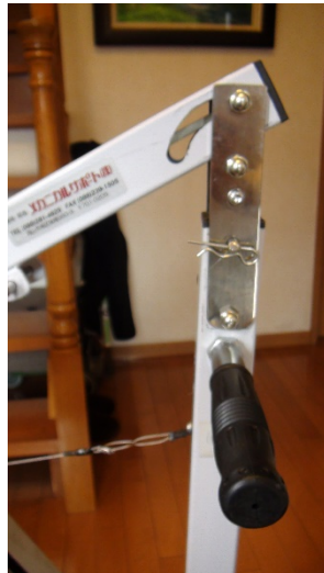
ハンドルの入れ方