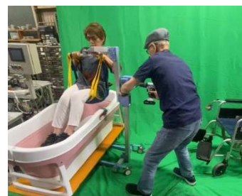
ユニットバスでの使い方