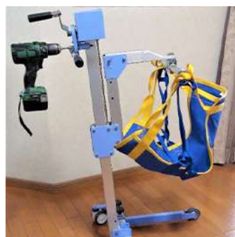
本体重量 13Kg 電動ドライバー駆動