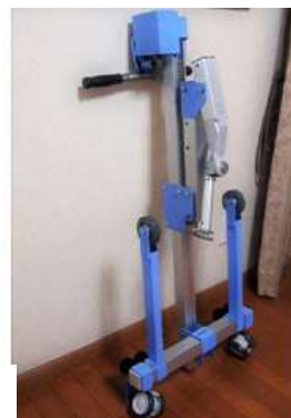
折りたためばこんなにコンパクト