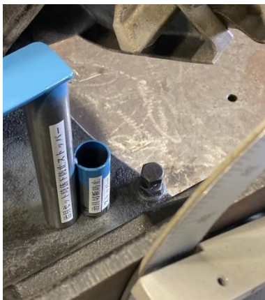
アダプター取付前