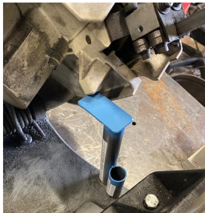
バンドソーを上げて ストッパーした状態