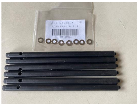
⑥ 斜切りガイド (オプション品) 使用中にガイドの摩耗があります 0.2 mmのシムリングを取付ネジの下部に入れる事でガイドが90° ずつ位置が変わりますので3枚でガイドが4方行使うことになります (6本セットで既に2本取り付けてあるので予備は4本になります)