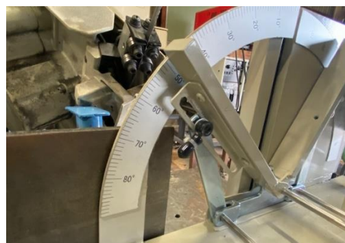
角度固定ネジ、ノブ