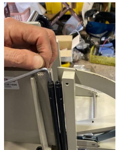
⑤ 斜め切り防止ガイドの取付