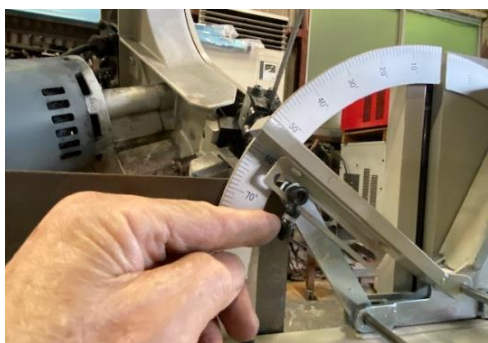
③ 角度固定ネジはノブを引くとゆるみ、押すと固定