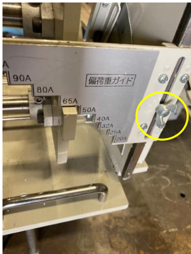
④ 偏荷重ゲージは右のちょうネジをゆるめゲージを上下してください