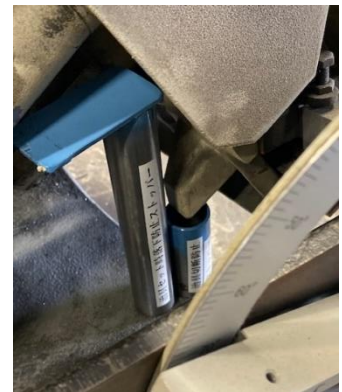
バンドソー下限ストッパー の状態 つけないと治具を 切ることになります